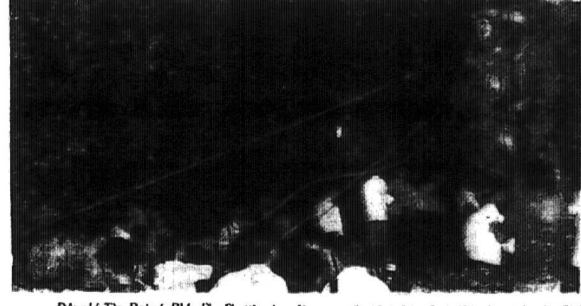
Đội phái Tả Đồi và Pháp liên lạc trên cầu... (mà họ đã ở trên sân trước) Kéo... ông Tiến Tây vum M!