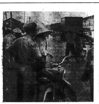
Thùng đồ gia, vật làm sản... cũng là sự sống.

Sinh hoạt của chợ trời khá rộn rịp hơn hết là lúc tan chợ. Anh em công nhân khua vác ra về với 1 bó tời, tay với 3 chai nước không, túi áo bó 1 hộp sữa mốp mốp. Họ luyên luyên môn liệt với vật dưới gầm tàu kệ ra công thêm được vài chục bạc. Giao lưu với bắp và nhũ sống ấy lại không ít thì bán hay bán lần công có người mua vớt.