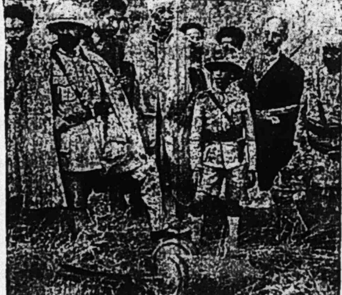
A hoàng và hoàng-tử đương đứng xem một quả bom trên máy bay Ý ném xuống mà không nổ

Dư luận ở Quốc-Liên Geneve, 2-5. — Các giới ở Quốc Liên cho việc A hoàng xuất dương là kết liễu phần quân sự trong cuộc xung đột Ý-A. Các phần ngoại giao thì vẫn có vẻ rỗi rảnh, vì A hoàng không chịu từ ngôi. Dư luận ở Anh London, 2-5. — Dư luận ở London kỳ việc A hoàng xuất dương mà nói rằng ý ta hoàn toàn thất vọng, và là ý thường hại cho sự phân chia A hoàng, muốn Chính phủ Anh đừng nộp ngôi trong một nơi nào thuộc dưới quyền cai trị của Anh.