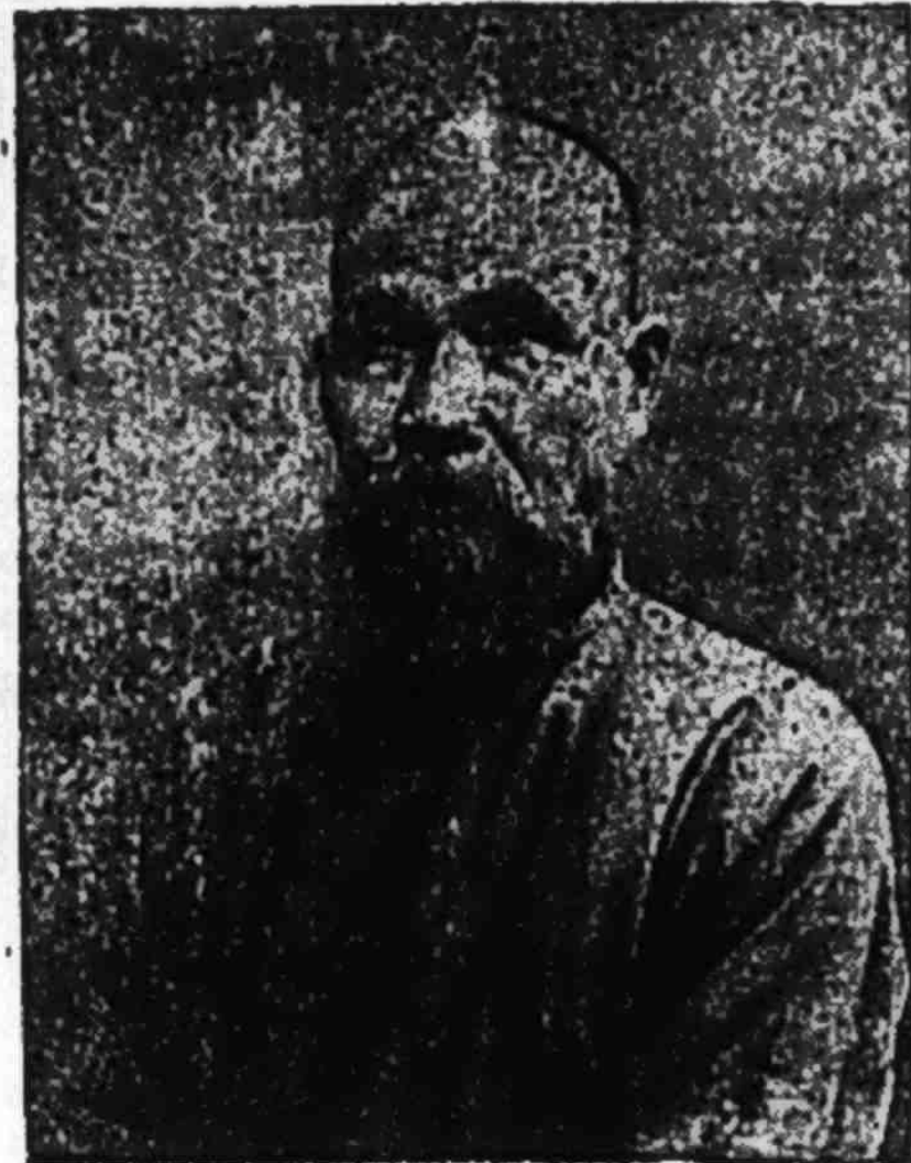
THƠ VINH TẾT (10 bài)

Sanh kế can thiệp có đến hay mà ở trong cũng có đến bất tiện là thế. Gần đây vì sự đặc biệt trích lực, trong dân gian đã lì nhà mà ruộng như trước, đó cũng là do sự can thiệp sanh kế mà sanh ra. Vậy muốn cho nhân dân được an cư lạc nghiệp, khỏi đến ta thán, ai cũng có lòng tin tưởng, mong rằng những công cuộc lớn như dân thủy nông, mở số khừn hoang lập công xưởng lớn v.v., chánh phủ nên can thiệp, còn như việc sanh kế về cá nhân, nhất là nghề nông, đàng