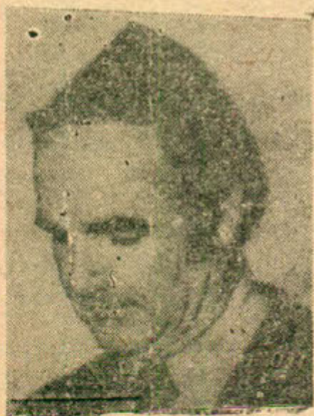
Ông George McGovern

Năm 1922, khi một nước Hoa-kỳ vừa chiến thắng trong cuộc Đệ-nhất Thế-chiến đang dòn phiêu cho đảng Cộng-hòa để từ bỏ chính-sách can thiệp của vị Tổng-thống Dân-chủ Woodrow Wilson hầu trở về chính-sách biệt lập thì cậu nhỏ George Stanley McGovern ra đời. George McGovern sinh trưởng tại tiểu-bang Nam Dakota. Tại Hoa-kỳ người ta có hai tiểu-bang mang tên Dakota, một Nam Dakota và một Bắc Dakota. Nếu