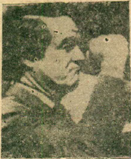
Ông Sargent Shriver

Người ta khó có thể tưởng tượng được sự khác biệt giữa hai ứng-cử-viên Tổng-thống và Phó Tổng-thống của đảng Dân-chủ. Thật vậy, nếu George McGovern sinh trưởng trong một gia đình nghèo khó thì Sargent Shriver lại thuộc về giai cấp thượng lưu của xã-hội Hoa-kỳ. Nếu George McGovern bị học hành gián đoạn, có cuộc đời lên voi xuống chó, thì Sargent Shriver lại được học hành chu đáo, có cuộc đời nghề nghiệp rất thành công.