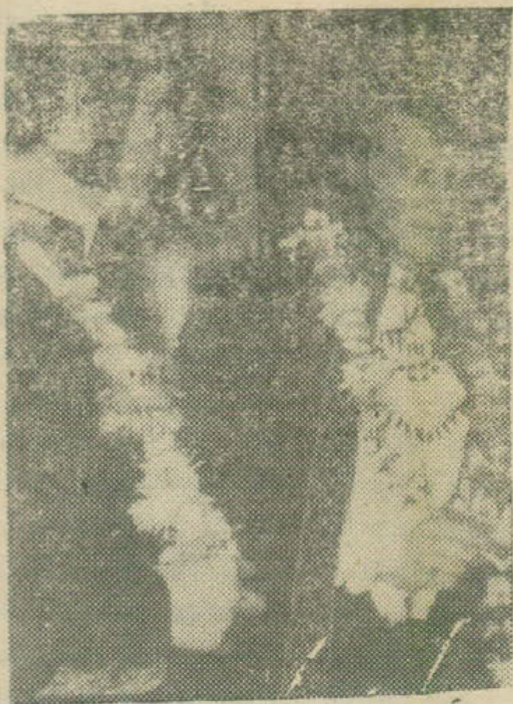
Hippies tại San Francisco và