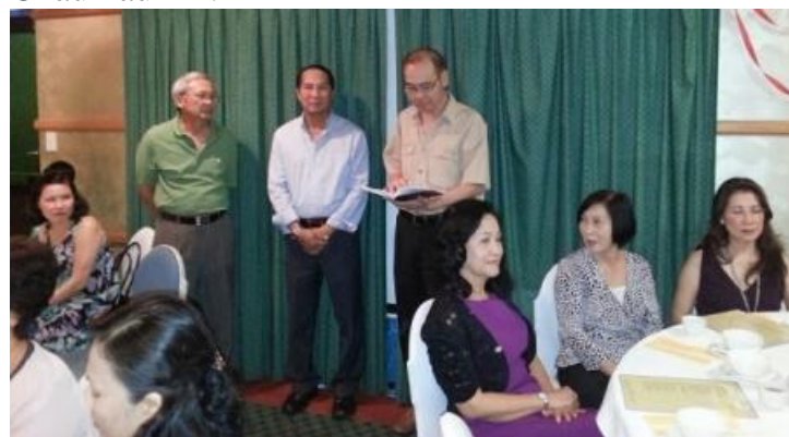
H p m t c a gia ình CHS N C LN H M Tho t i Bríbane mi n n ng m