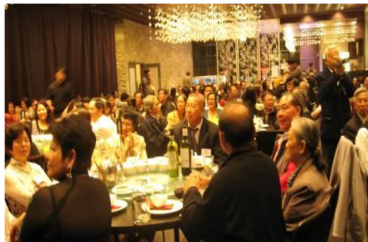
Quang cảnh i hội liên bang Úc Châu ngày 01/09/2012