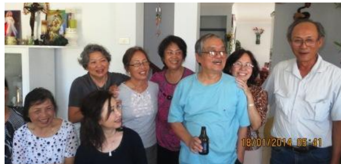
C m bia u ng, v ng sau, Cùng c i h nh phúc xuân nào vui h n?