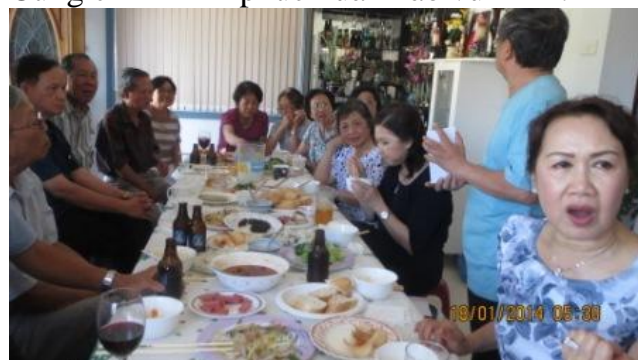
Ng c Hân, Ng c Bình , Ngoc Th m mà Ng c Châu âu r i?