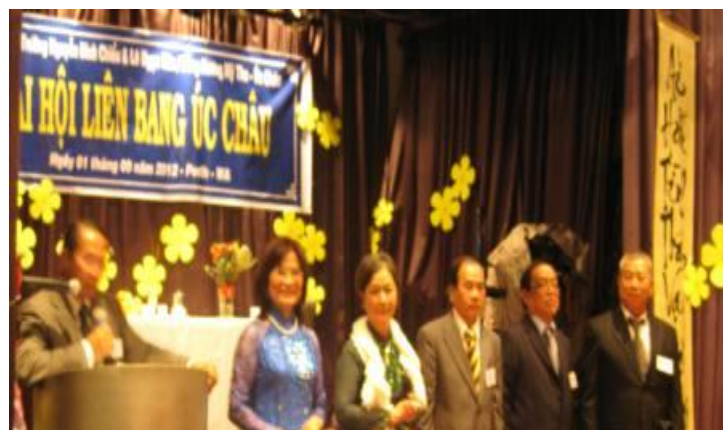
Ban Chấp hành của Hội Ái Hữu CHS N C LNH Melbourne Liên Bang Úc Châu từ ngày 01/09/2012 ...