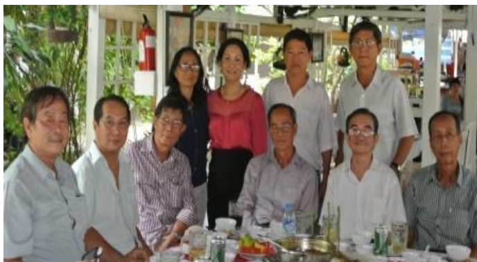
Thầy trò toàn tụ từ quê nhà Melbourne