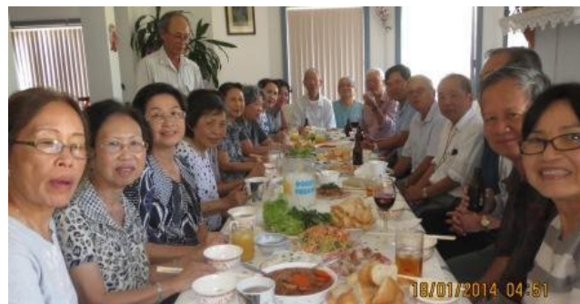
Quang c nh h p m t t i Sydney ngày 18/01/2014.