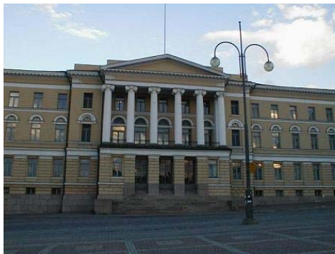
Đại Học Helsinki

Helsinki of Technology và ĐH Thương mại Helsinki. Nhưng so với các ĐH danh tiếng của Anh, Mỹ, Pháp ,Đức. trình độ. ĐH của PL còn thấp hơn nhiều.