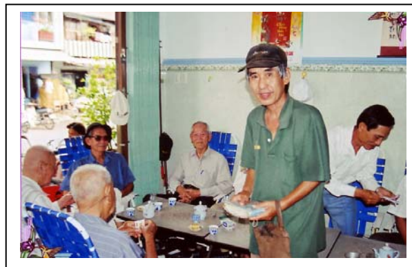
CHS Lê Thanh Khiết và tập vé số trên tay

Hay qua Thủ Quỹ của Hội AH NDC & LNH tại California, Hoa Kỳ. Tôi thành tâm cầu nguyện Ông Thần Điều Hòa linh thiêng phò hộ quý vị.