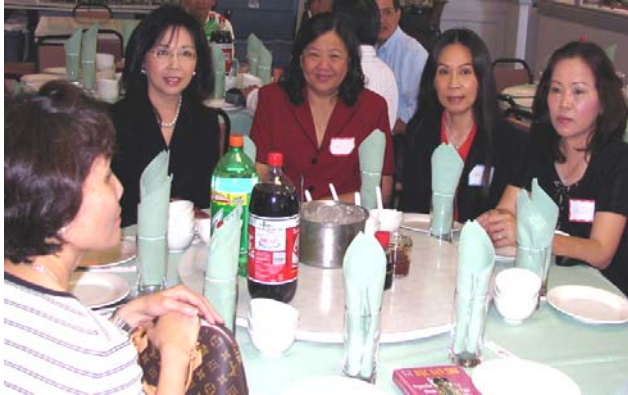
CHS Lê Ngọc Hân và Dâu Nguyễn Đình Chiêu