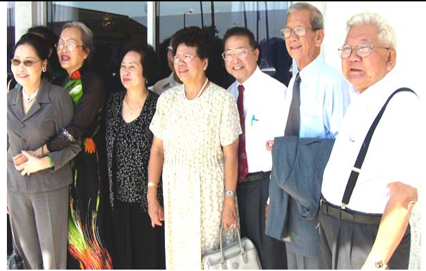
Các CHS “tiền bối” gặp nhau .