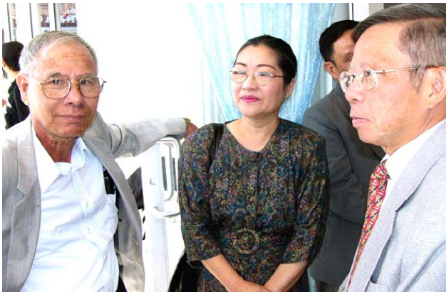
GS Khởi và ÔB.GS Kính