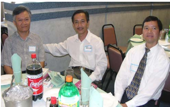
Các CHS NĐC lần đầu tham dự họp mặt