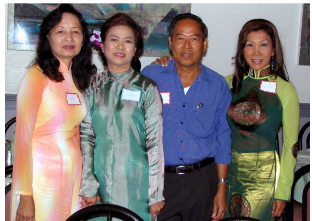
Con Gái LNHC và Dâu NĐC