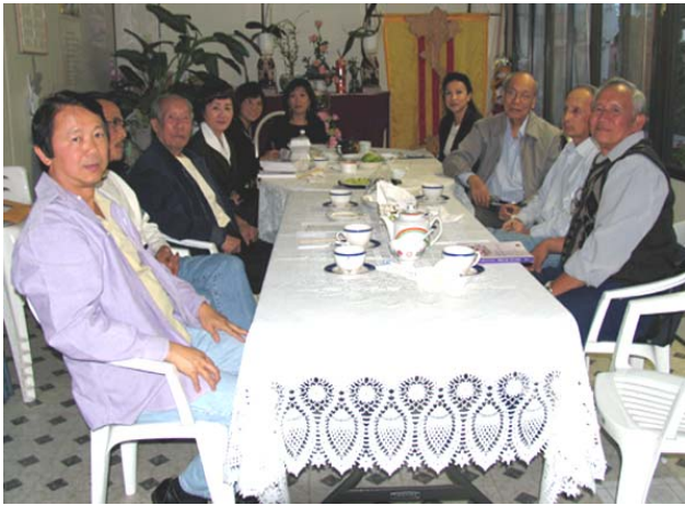
Quý vị GS Cố Vấn và BCH họp mặt để thảo luận chương trình sinh hoạt trong tương lai