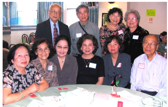
GS Liêm, ÔB GS Đăng và các thân hữu CHS