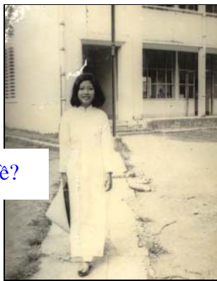
Nữ sinh này đang vào lớp hay đi về?