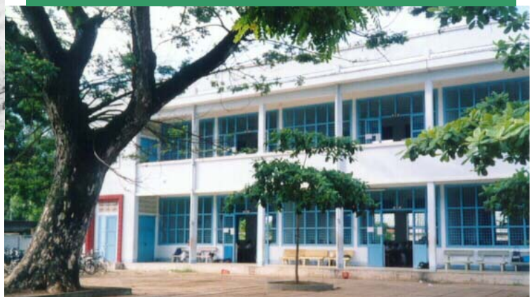
Cây cổ thụ vẫn trợ gan cùng tuế nguyệt trong sân trường