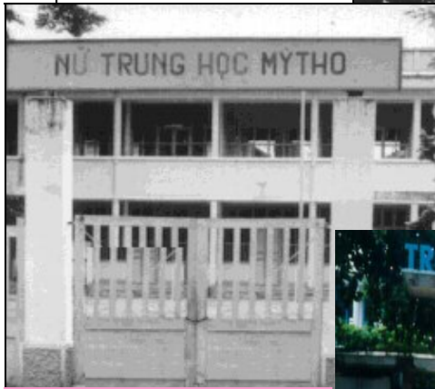
Cổng trường năm 1957