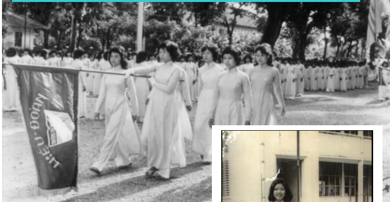
Lễ ra mắt Hiệu Đoàn Trường LNH niên khóa 60-61