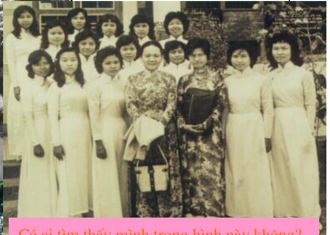
Có ai tìm thấy mình trong hình này không?