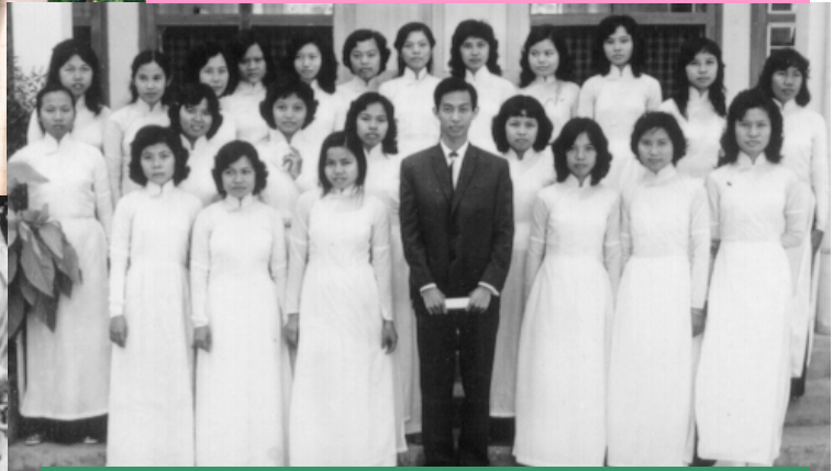
Thầy Hữu dạy Việt văn "bất đắc dĩ" lớp này chăng?