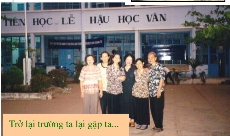
Trở lại trường ta lại gặp ta...