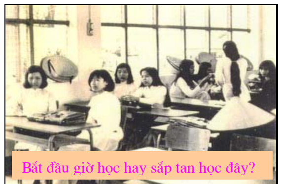
Bắt đầu giờ học hay sắp tan học đây?